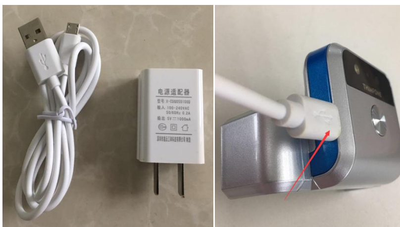
图 2.5-1 原装充电器图