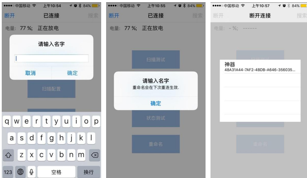
图 4.4-1 神器的状态及更名