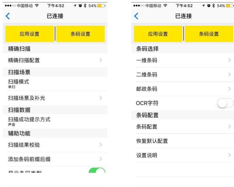
图 4.2-2 自动测试