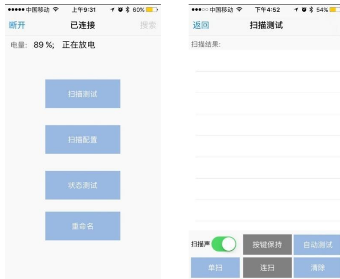
图 4.2-1 扫描