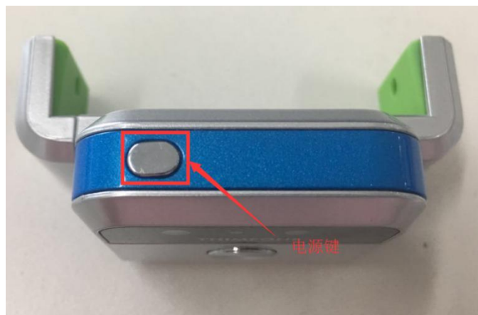
图 3.1-1 电源键