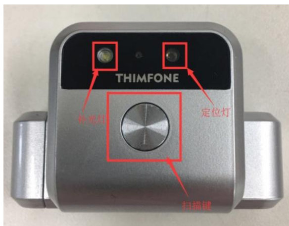
图 3.2-1 扫描键