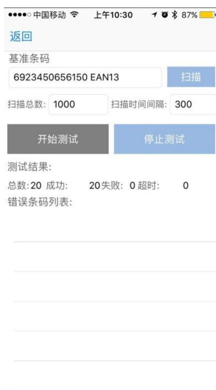
图 4.2-2 自动测试